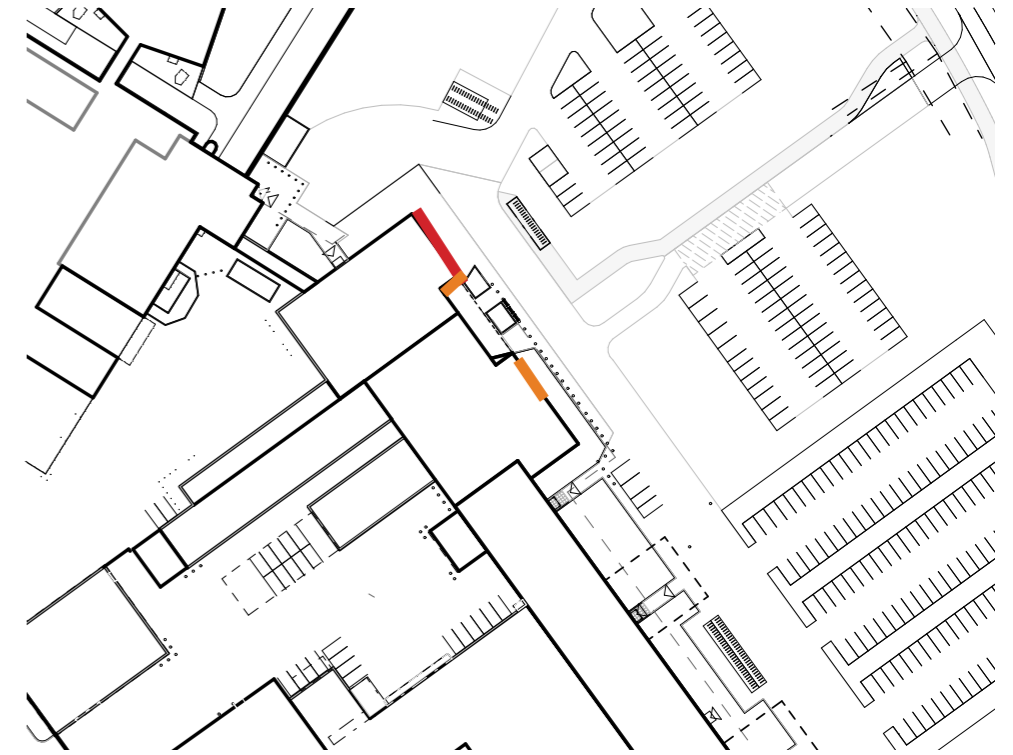
Teoksen sijoittuminen: pääasiallinen sijainti punaisella, mahdolliset lisäosat oranssilla.

Teoksessa käytettävä kulta on hankittu Lapista, Tankavaaran kullanhuuhtojilta. Kulta erotetaan jokihiekasta painovoiman avulla, eikä prosessissa käytetä minkäänlaisia haitallisia kemikaaleja. Kotimainen Lapin lehtikulta on ainoa ekologisesti ja eettisesti valmistettu lehtikulta maailmassa.