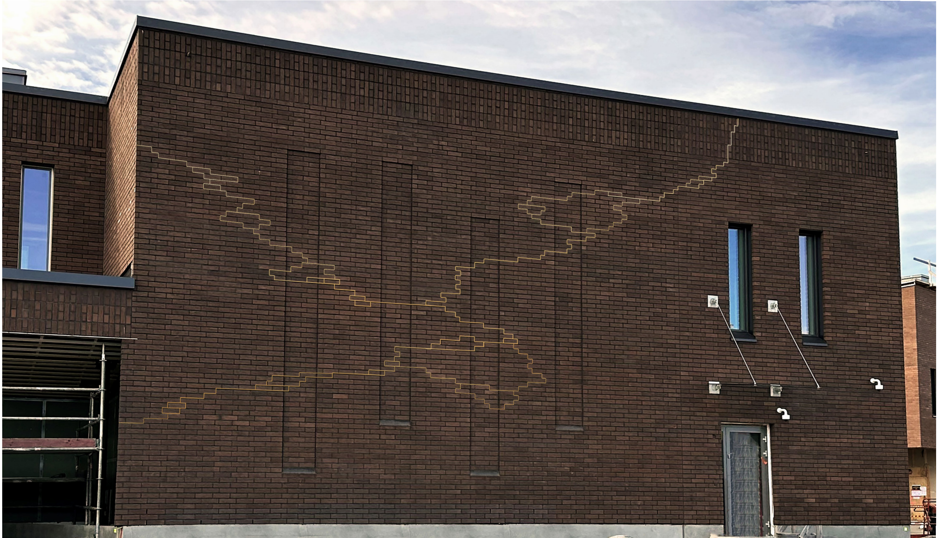
Luonnos teoksesta ja sen sijoittumisesta suurelle seinäpinnalle.

Taideteos Oulun pääpoliisiaseman ja Oulun vankilan uudisrakennukseen