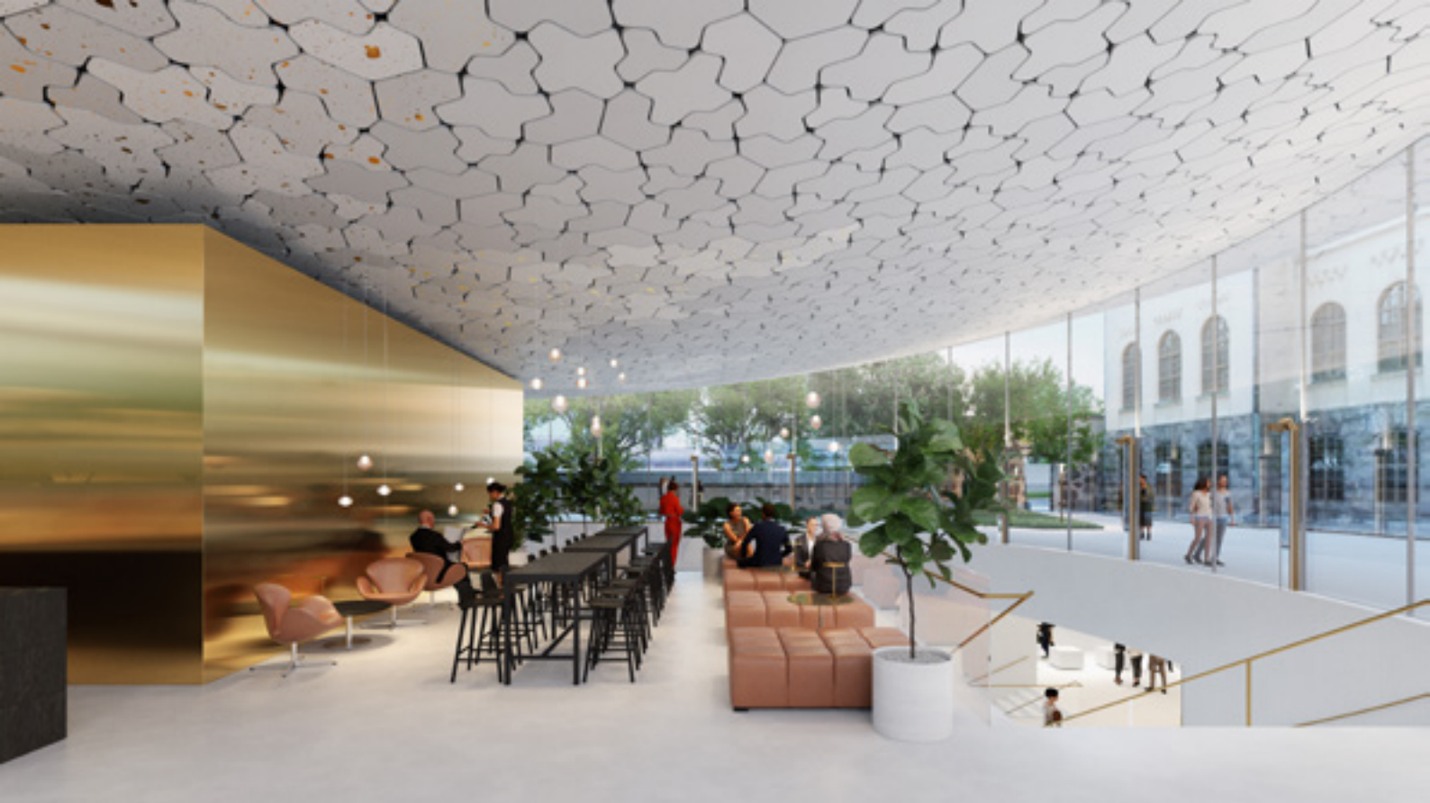
Kuva: JKMM Arkkitehdit Oy